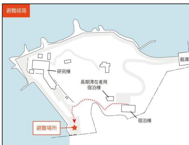
図1. 宿舎棟からの避難経路 (赤破線)